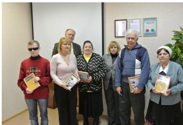
Поэтический конкурс «Парус надежды»