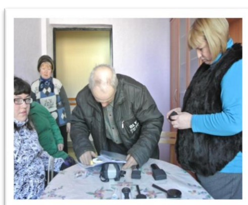
Могилевская районная организация