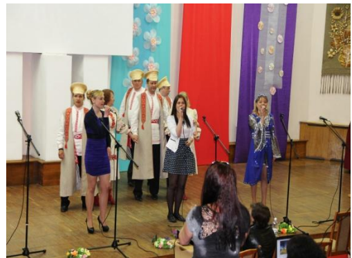
Областной фестиваль творчества инвалидов по зрению «На вулицы гримата»