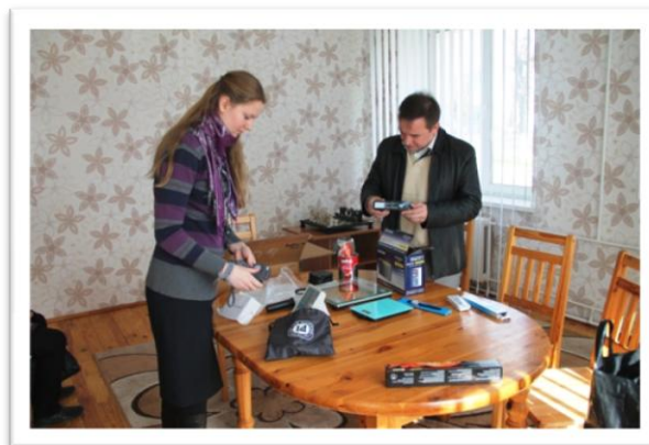
Кировская районная организация