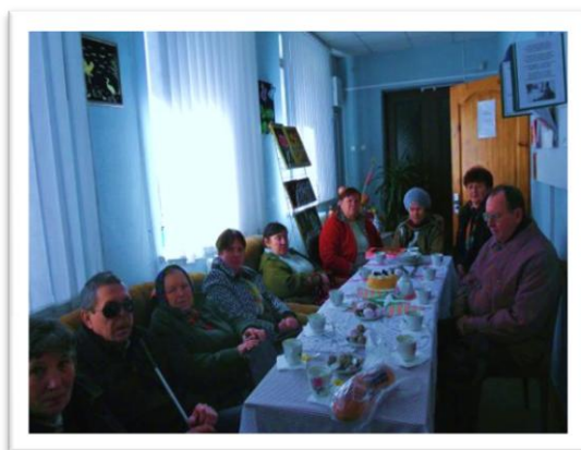
Бельничская межрайонная организация