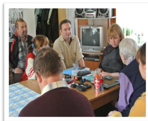
Осиповичская районная организация

На базе детской юношеской школы искусств в г.п. Кировск 14 мая проходит областной фестиваль творчества инвалидов по зрению «На вулицы гримата», в котором принимает участие коллективы художественной самодеятельности.