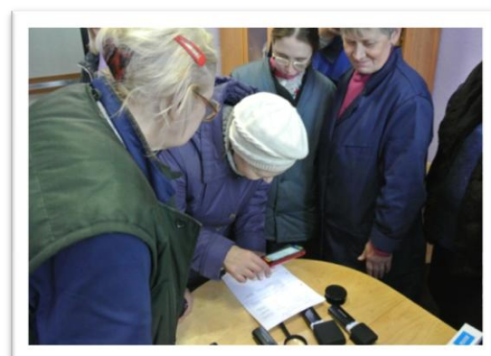
Унитарное предприятие «Тифлос»